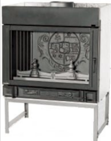
FOYER 152 C