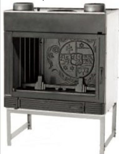
FOYER 162 C